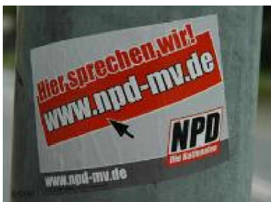
Bildunterschrift: Großansicht des Bildes mit der Bildunterschrift: "Hier sprechen wir", wirbt die NPD